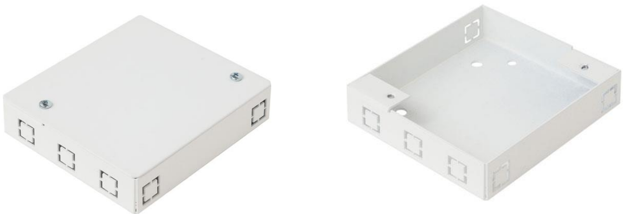
Рисунок 1 - Общий вид коммутационной коробки КК-2757

1.3 Общий вид коммутационной коробки, показан на рисунке 1.